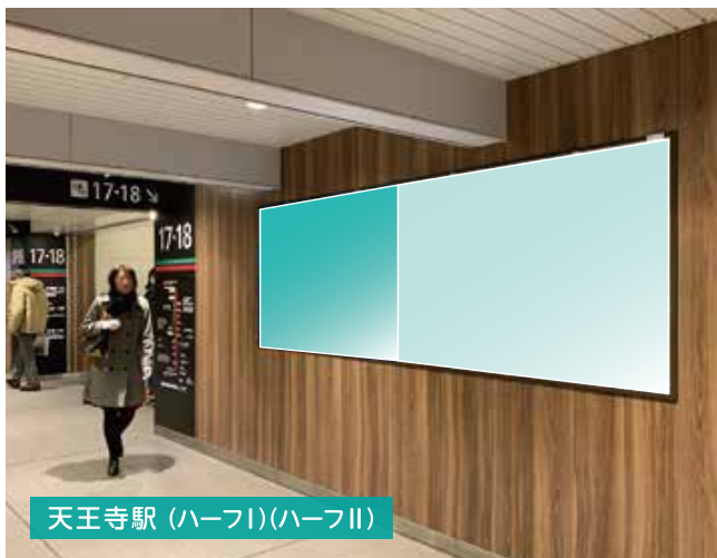
天王寺駅 (ハーフI)(ハーフII)