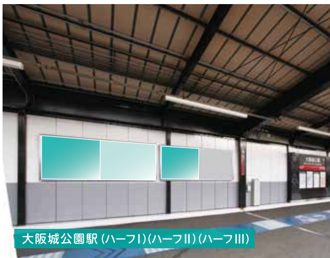
大阪城公園駅 (ハーフI)(ハーフII)(ハーフIII)