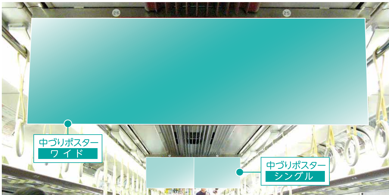
中づくりポスター ワイド