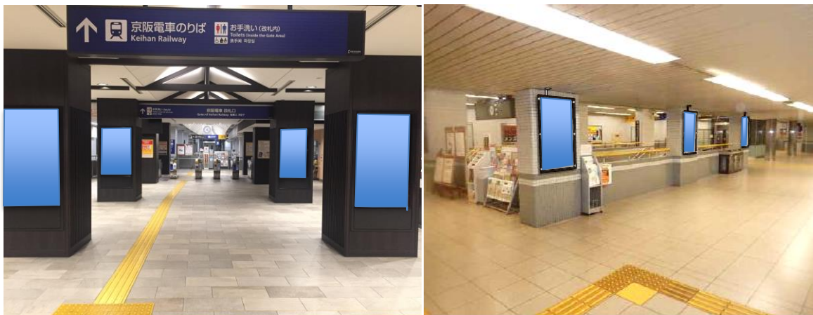
掲出位置図（祇園四条駅B1階改札内階段柱壁面／改札外柱面）