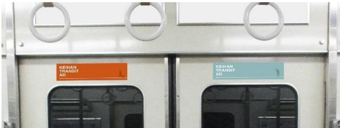
■ 京阪線車両掲出位置

■ 左右ペアの特性を活かした自由な広告表現が可能。高い注目度を生み出せる媒体です。