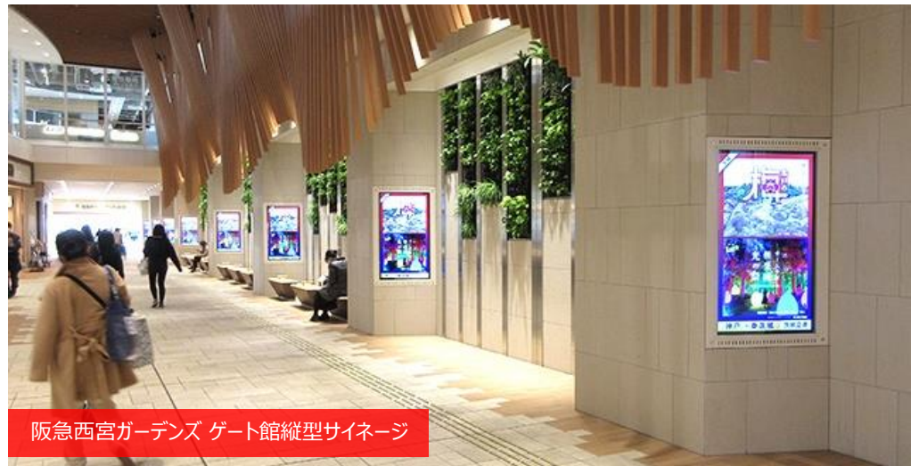
阪急西宮ガーデンズ ゲート館縦型サイネージ