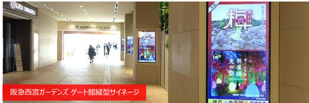
阪急西宮ガーデンズ ゲート館縦型サイネージ