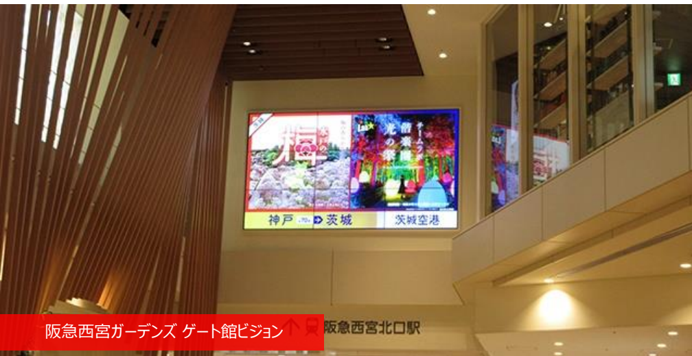
阪急西宮ガーデンズ ゲート館ビジョン ↑ 阪急西宮北口駅