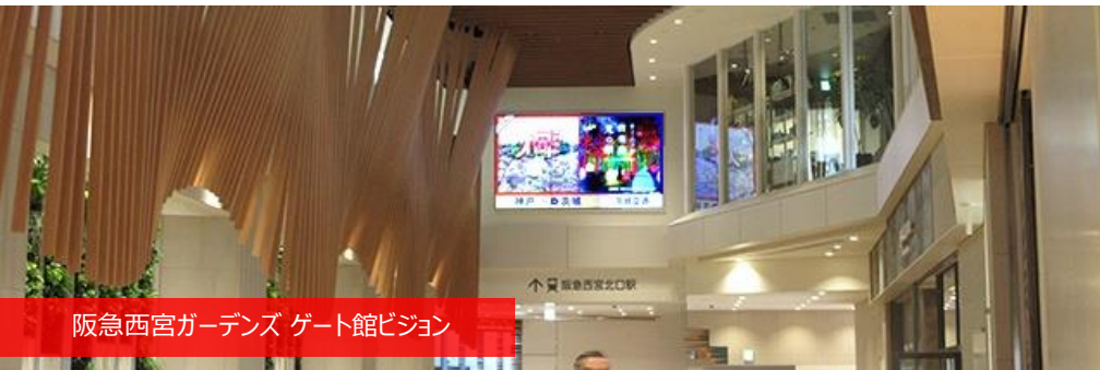
阪急西宮ガーデンズ ゲート館ビジョン