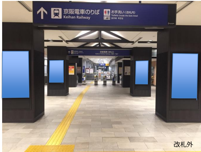
掲出位置図（祇園四条駅B1階/改札外柱面）