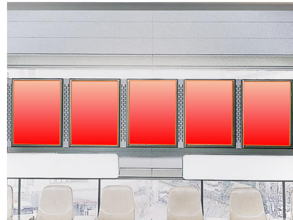
■ ポスターサイズ (単位：mm)