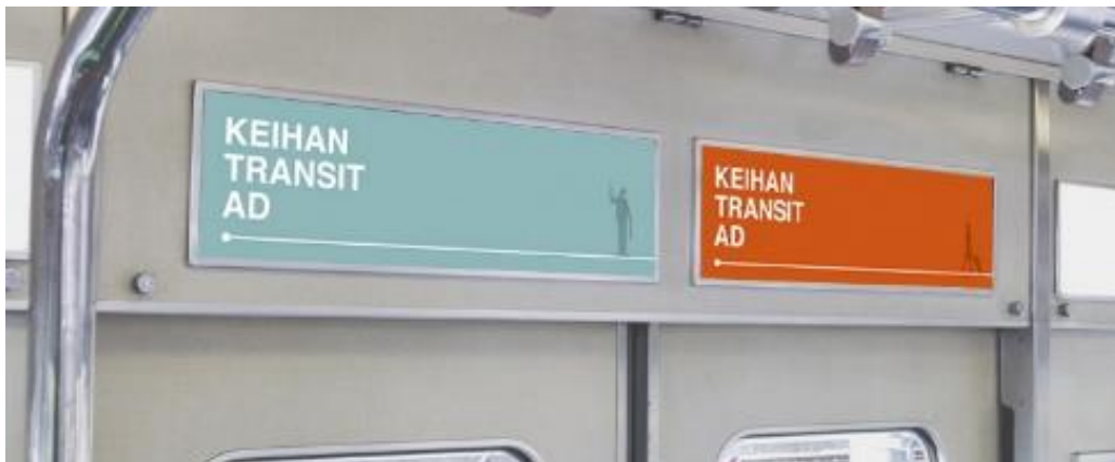
■ 京阪線車両掲出位置