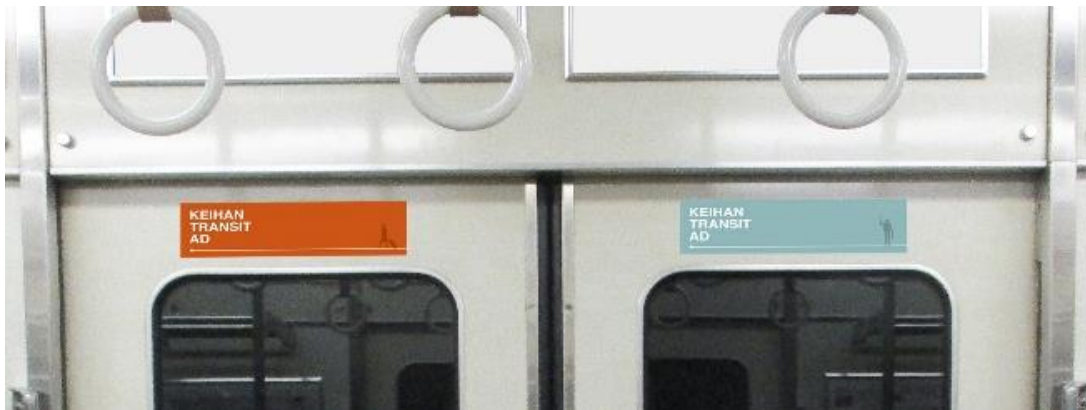
■ 京阪線車両掲出位置