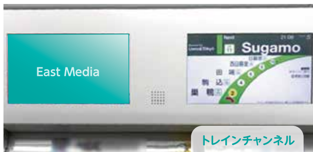
トレインチャンネル

TRAIN TV = JR東日本 車内サイネージを核とする動画配信プラットフォーム