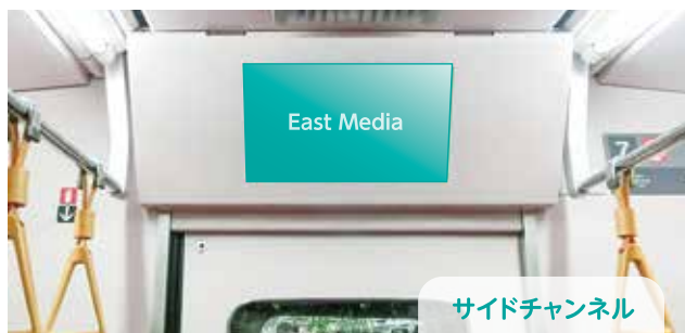
サイドチャンネル