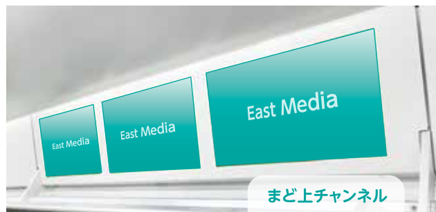
まど上チャンネル