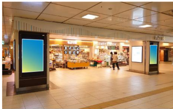
天満橋駅/乗降者数 47,413人/日