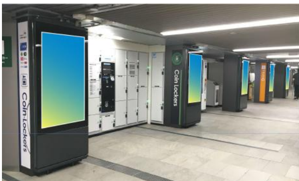
北浜駅/乗降者数 30,775人/日

■京阪沿線の主要6駅に設置されているデジタルサイネージに、まとめて放映可能なセット商品です。6駅同時放映による訴求効果的なPRを実現いたします。