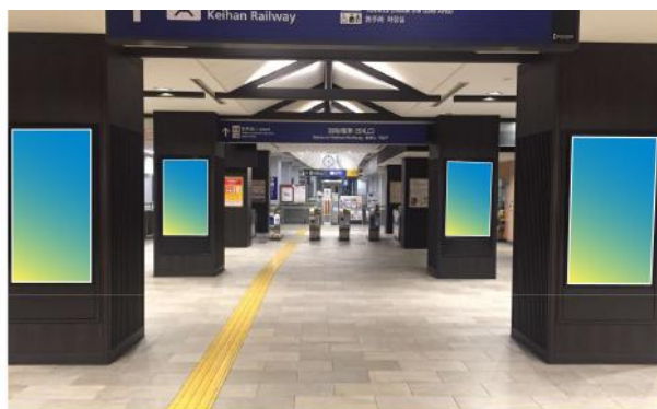
祇園四条駅/乗降者数 35,736人/日