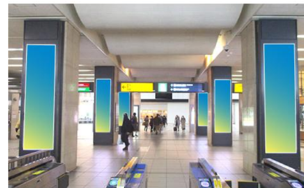
京橋駅/乗降者数 134,530人/日